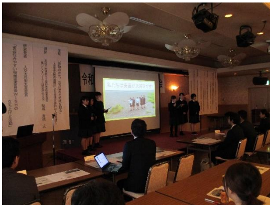
生徒研究発表(安芸桜ヶ丘高校チーム WISH)