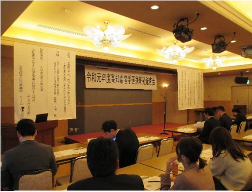
会場前面 各種横断・懸垂幕