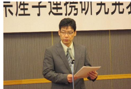
竹崎実高等学校課課長挨拶