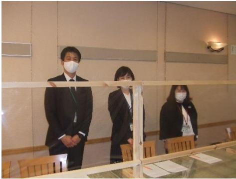
受付では検温チェックなども