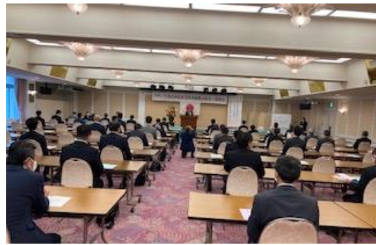
会場全体後方から