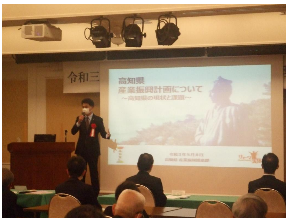
「高知県産業振興計画について」沖本部長講演